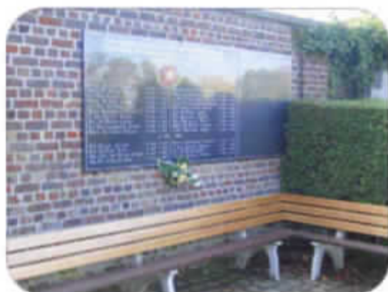
Gedenkplaat voor de overleden Melse brandweerlieden.