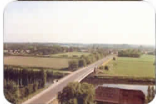
Zicht op de betonnen brug (1956) over de Schelde.