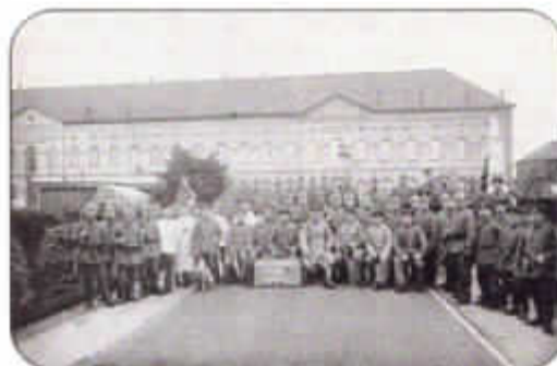
Gedurende geheel W.O. I werd het college ten dele bezet door Duitse troepen, hier een troep soldaten, foto daterend uit 1916.

1914 Een breekpunt, zelfs een eindpunt voor een aantal zaken. Door de oorlog met de Duitsers en de bezetting keren de buitenlandse studenten niet meer terug. De hogere schoolafdelingen trekken geen leerlingen meer aan. Installaties worden vernield en geplunderd. De schitterende musea krijgen hun doodsteek.