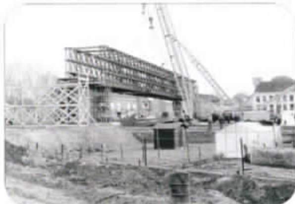
Plaatsing van de Baileybrug op woensdag 15 april 1992, van op de Scheldeoever te Heusden, aan de overzijde van de Pontstraat.

Wie over de onderscheiden bruggen over de Schelde meer wenst te lezen kan terecht in ons tijdschrift De Gonde, jaargang 21 (1993), nr. 2-3, p. 33 en volgende.