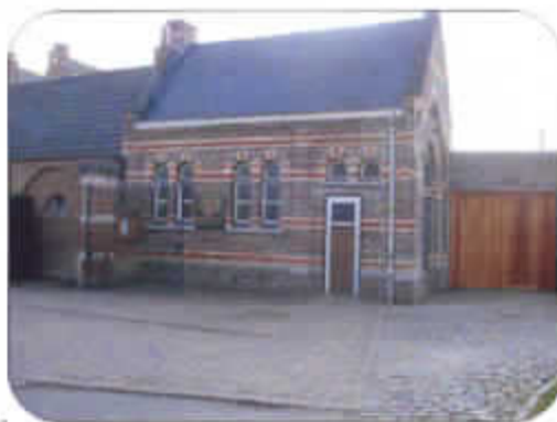
Zijkant van het dodenhuisje aan de ingang van de gemeentelijke begraafplaats.