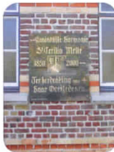
Gedenkplaat voor de overleden leden van de Koninklijke Muziekmaatschappij Sint-Cecilia.