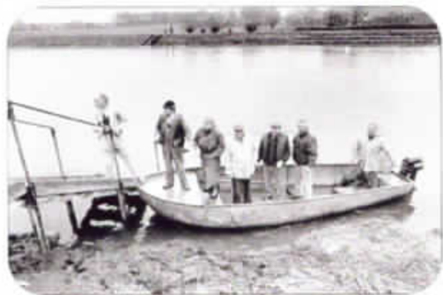
Het veer, in gebruik genomen op 23 maart 1992, foto genomen door Manuel Debruyne van op de Scheldeoever te Melle.