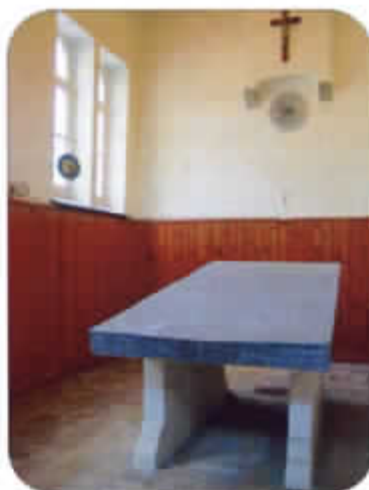
Zicht binnenin het dodenhuisje.