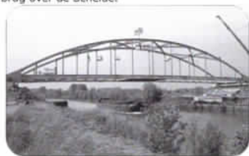
Stalen brug over de Schelde (1993).