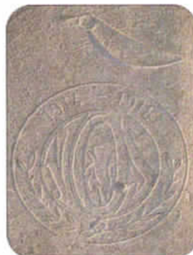
Detail met het embleem van de V.O.S. en de stormvogel.