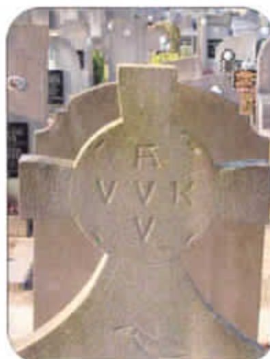
Detail van het kruis met de ingegraveerde letters A.V.V.-V.V.K.