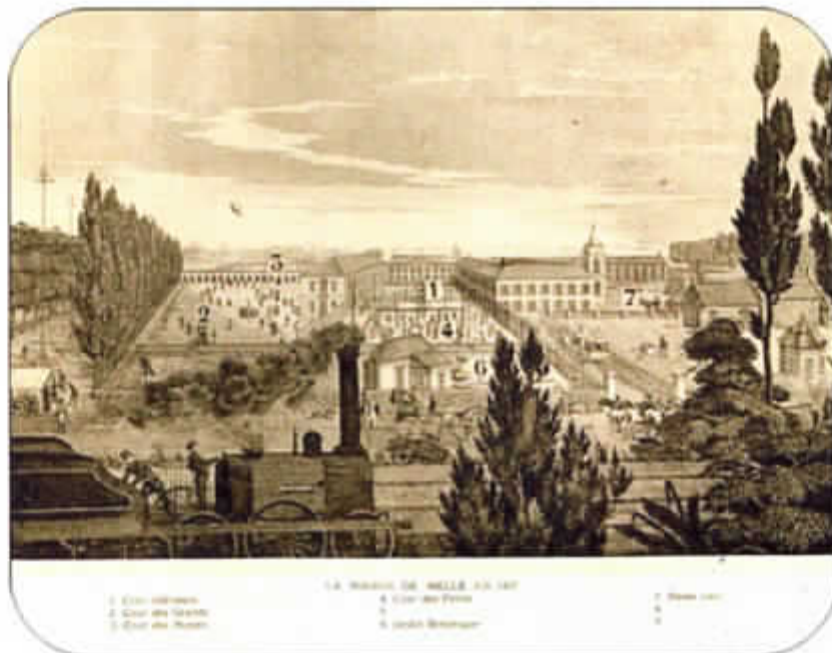
Zicht op de gebouwen van het college anno 1837, overgenomen uit een prospectus van het 'Maison de Melle (Belgique)', jaar 1912.

175 jaar geleden namen de Jozefieten hun intrek in de gebouwen van het college, dat toen bestuurd werd door leken. Deze gebeurtenis kan men zo maar niet laten voorbijgaan. Daarom wil men dit feit herdenken en vieren met een reeks van festiviteiten.