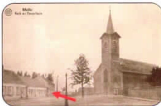
Dorpsplein/Melle, de rode peil wijst naar de gevel van de woning waarnaar het kapelletje eind de 18 de eeuw werd overgeplaatst.