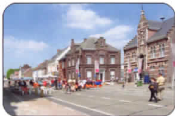
Steenweg 300, zondag 16 mei 2004, de Brusselsesteenweg verkeersvrij