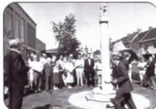
Onthulling van de gerestaureerde schandpaal van Melle (Gemeenteplein, 5 juli 1987)