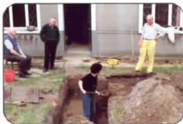
Opgravingen in de Schauwegemstraat te Melle (1993)