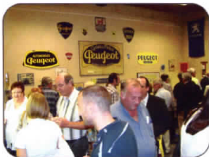
Opening van de tentoonstelling "Peugeot, een leeuwenaandeel" in het Gemeentelijk Museum, 27 juni 2008