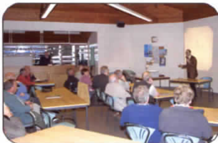
Lezing door prof. Georges Declercq over Sint-Bavo in het G.O.C. te Gontrode op 16 september 2005