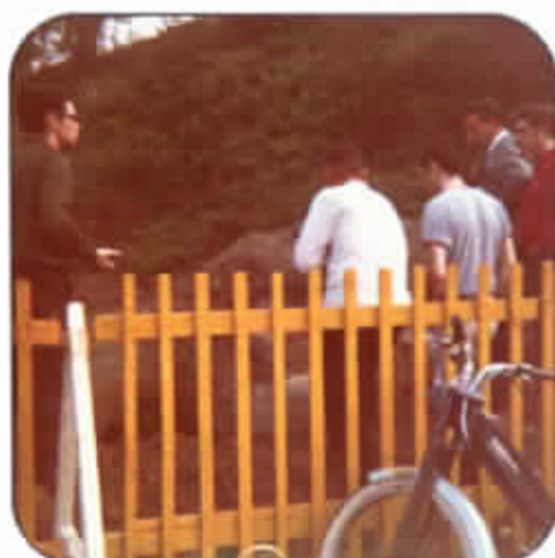
Archeologische opgravingen in de zomer van 1971 op zoek naar sporen van de vernielde burcht Cortrosine (omgeving van de bassins aan de huidige Ovenveldstraat)