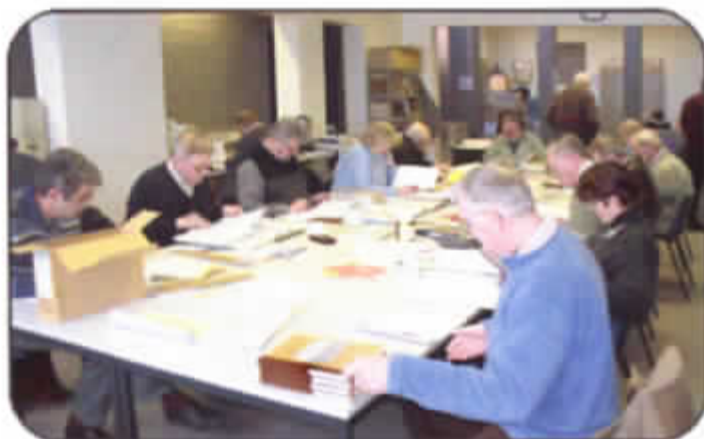
Zicht op een gedeelte van de in 1998 in gebruik genomen nieuwe leeszaal van het Gemeentelijk Archief en Documentatiecentrum