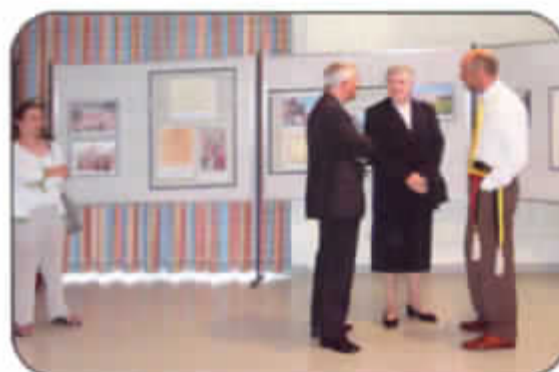
Tentoonstelling in september 2002 klooster H. Hart (vandaag gekend als het Woon- en Zorgcentrum Kanunnik Triest)