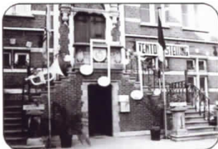
Versierde voorgevel van het Gemeentelijk Museum n.a.v. de tentoonstelling "D'er zit muziek in" (zomerkermis Melle, 1990)