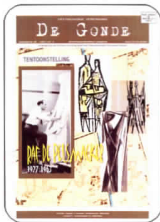
Kaft van een nummer van ons driemaandelijks heemkundig tijdschrift De Gonde (jaargang 35 -2007- nr. 2)