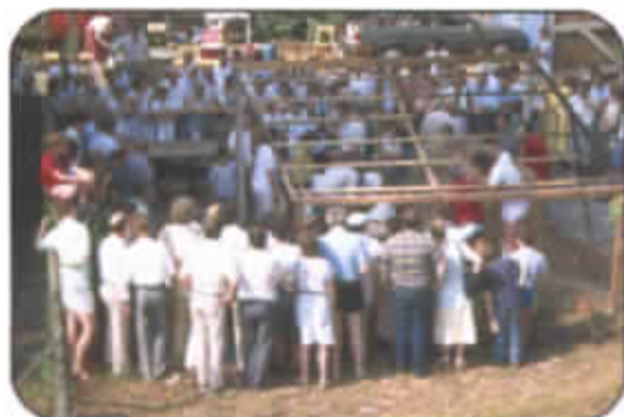
Project reconstructie van een staande Romeinse aardewerkoven, zomerkermis te Melle, locatie: terrein van de familie De Cock naast de Sint-Martinuskerk