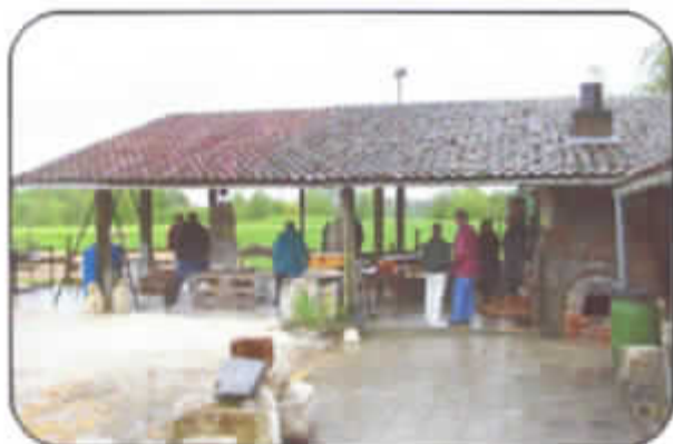
Het Kunst- en Vormingscentrum het Ovenveld (15 jaar werking, 2002)