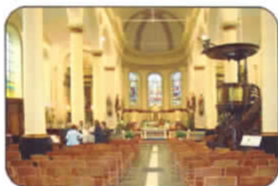
Open Monumentendag 2002, het interieur van de Sint-Martinuskerk