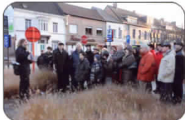
Gegidste wandeling op 11.11.2008 met als thema Wereldoorlog I te Melle, foto genomen op het gemeenteplein aan het monument van de Franse vlootfuseliers