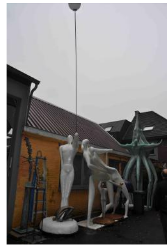
Werk van Guy Timmerman

Daar waar alle deelnemende kunstenaars in Melle woonachtig waren, kan niet hetzelfde worden gezegd van de bezoekers. Die kwamen zowel uit eigen gemeente als van ver daarbuiten. Er waren ateliers waar niet veel bezoekers waren langs geweest, een veertigtal – maar dan wel allemaal mensen die enorm geïnteresseerd waren, werd daar onmiddellijk aan toegevoegd. Bij andere ateliers hoorden we spreken over uitschieters tot 130 bezoekers over de twee namiddagen.