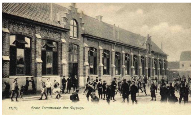
De gemeenteschool, foto uit de oude doos