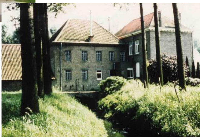
Watermolen / Gontrode