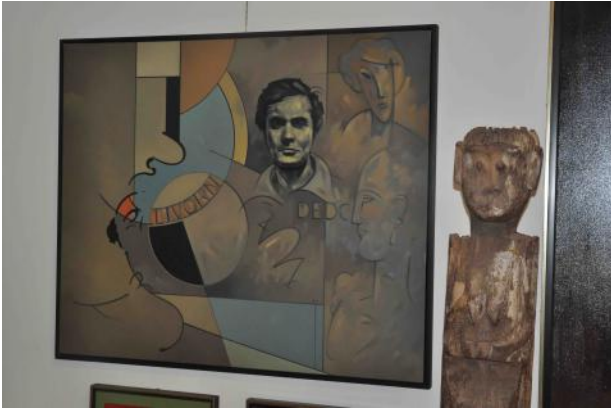
Werk van Arnold Verhé