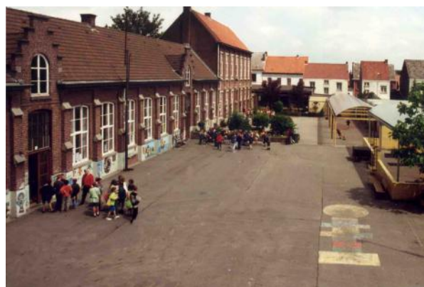
Recentere foto van de gemeentelijk basisschool