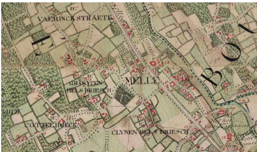
detail Ferrariskaart (1777)

De brochure en bijhorende fietszoektocht kunnen nog steeds gedownload worden via https://www.melle.be/fiets--en-wandelroutes