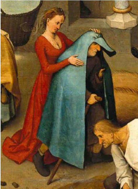
Detail uit het schilderij "De spreekwoorden", de spreuk: "Zij hangt haar man de blauwe mantel om".