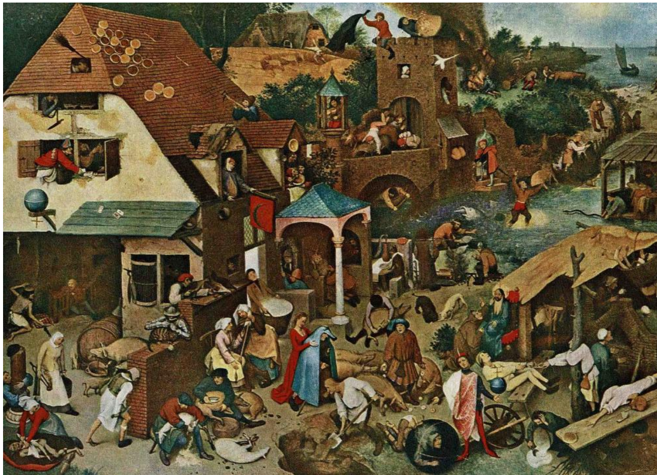
Schilderij "De spreekwoorden" van Pieter (de oude) Bruegel daterend uit 1559 (dit werk bevindt zich in het Staatliche Museen (gemälde galerie) van Berlijn).

Dit artikel mochten we van de auteur dankbaar overnemen uit het familietijdschrift "Scone Jahn" nr. 115. De diverse jaargangen van dit tijdschrift kunnen tijdens de openingsuren van het gemeentelijk archief en documentatiecentrum in de leeszaal geraadpleegd worden. Een aanrader voor wie in de familie Schoonejans (in al zijn schrijfwijzen) en aanverwanten geïnteresseerd is.