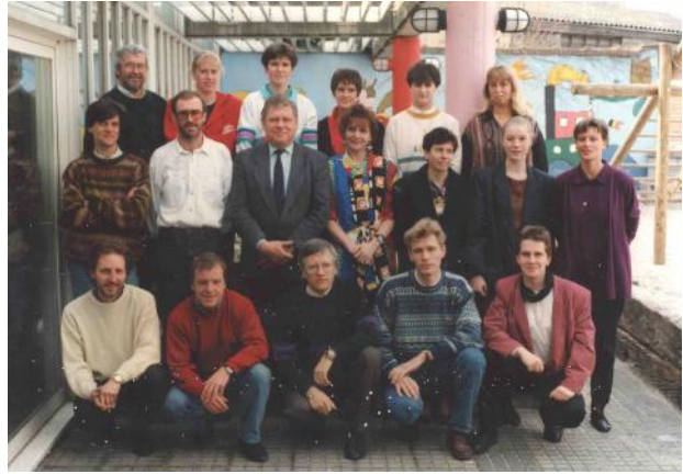
en midden het schoolpersoneel