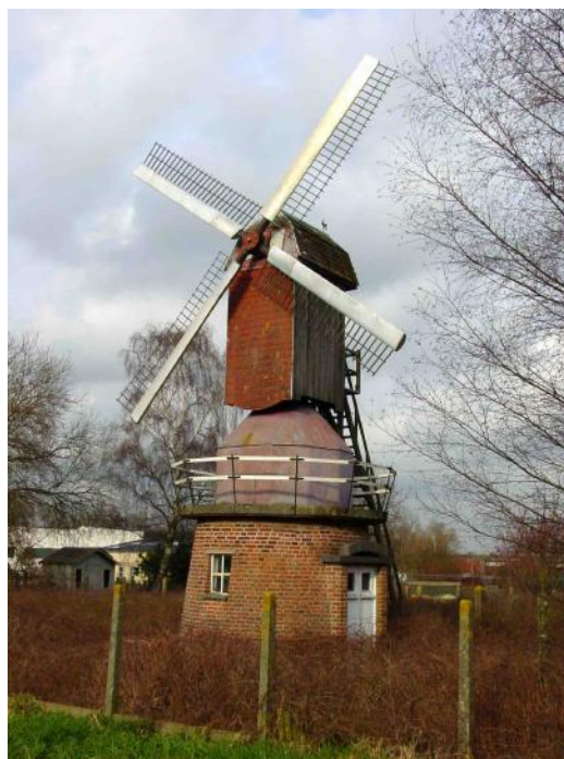
Meireleire's molentje / Gontrode