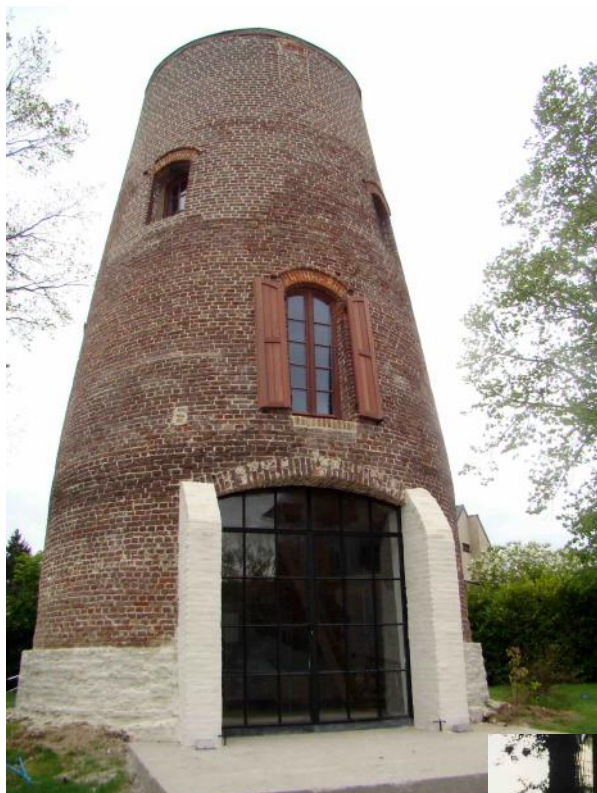
Restant molen De Coene / Melle

Zoals je hebt kunnen vaststellen, kan het molenaarsberoep nog veel interesse bij onze bevolking rekenen, en is het ook vanzelfsprekend dat we hieraan de nodige aandacht besteden.