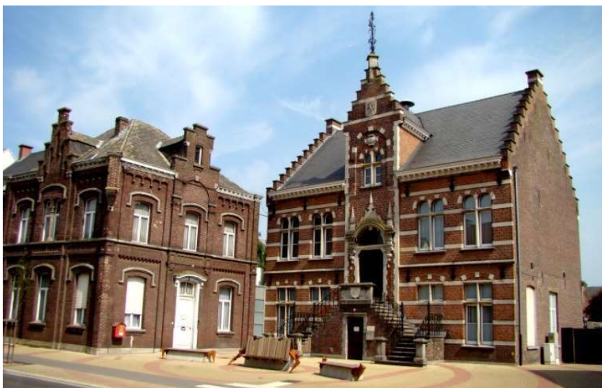
Erfgoedpunt Melle Brusselsesteenweg 393 - 9090 MELLE -